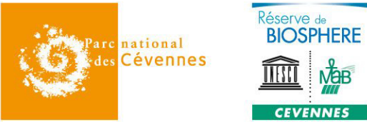
Implantation régionale du Parc