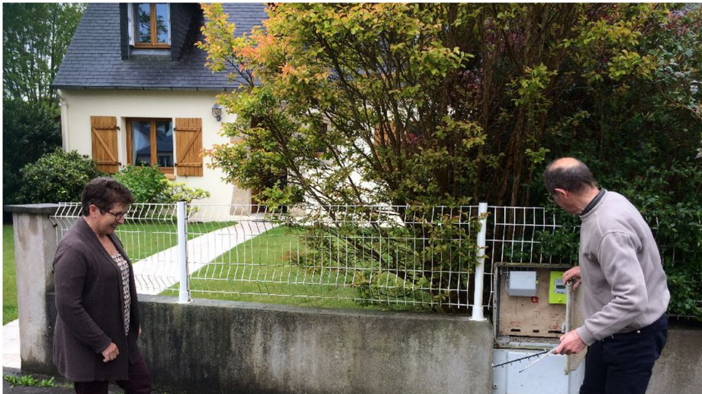
À Plouzané (29), ce couple a entamé une action au civil contre Enedis pour demander le retrait du compteur Linky.