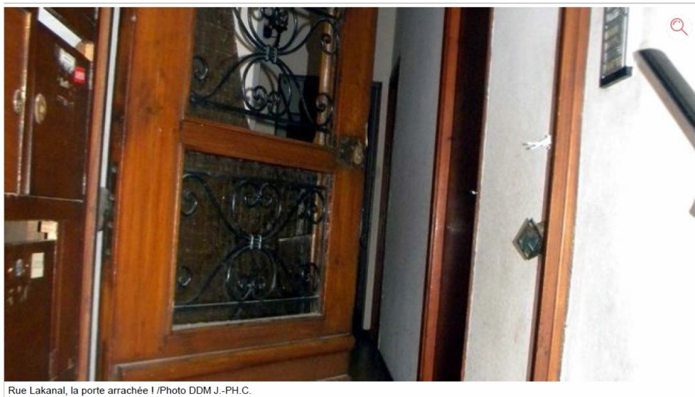
Rue Lakanal, la porte arrachée !

Deux installations de compteurs Linky en centre-ville donnent lieu à une levée de boucliers. Notamment une opération qui s'est traduite par une porte fracturée !