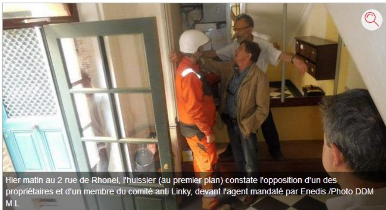
Hier matin au 2 rue de Rhonel, l'huissier (au premier plan) constate l'opposition d'un des propriétaires et d'un membre du comité anti Linky, devant l'agent mandaté par Enedis.

Face-à-face tendu hier matin, entre des techniciens (LS Services) mandatés par Enedis pour remplacer les anciens compteurs électriques d'ERDF par des modèles Linky et des habitants farouchement opposés à cette nouvelle technologie «intelligente», émettrice selon eux d'ondes néfastes pour la santé. Hier matin, vers 10 heures, deux équipes de LS Service se sont présentées au 2, rue de Rhonel, accompagnées d'un représentant d'Enedis et d'un huissier de justice. Plus trois agents de la police nationale venus veiller au grain.