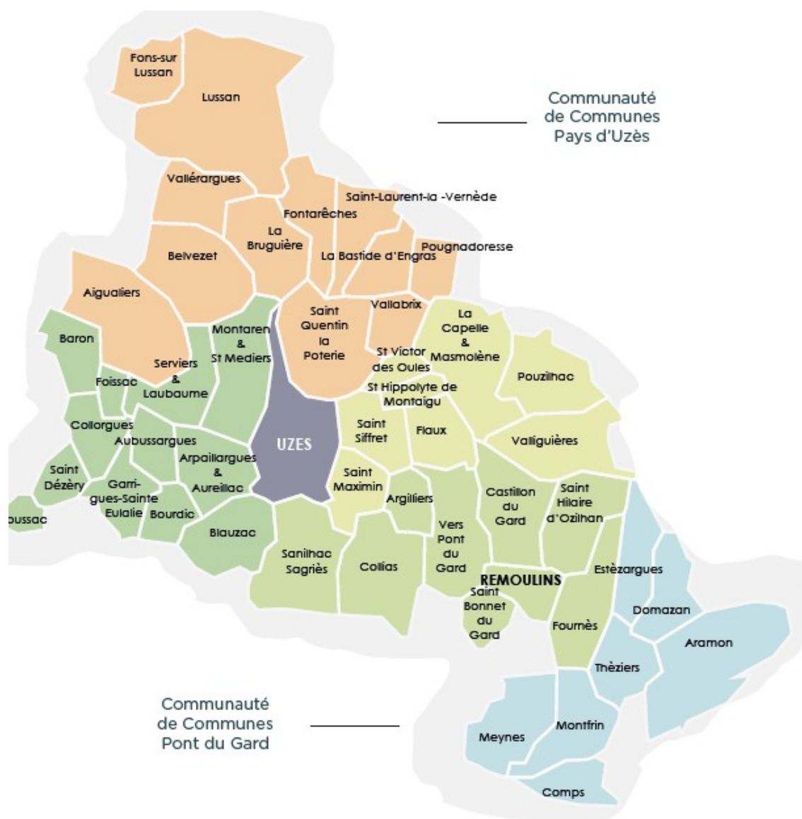
Les entités du SCoT - Cartographie issue du diagnostic page 17

Le territoire offre une variété importante de paysages. Au nord, les plateaux calcaires de Lussan sont recouverts d'une garrigue sèche propice au pâturage et ponctués de cultures de céréales, fourrages, vignes ou chênes truffiers dans les dépressions. À l'ouest et jusqu'à Uzès, la succession de collines de Foissac venant morceler la plaine agricole (blé et vignes) laisse place à une plaine drainée par les ruisseaux des Seynes et de l'Alzon, affluents du Gardon, au niveau de laquelle se dresse la colline d'Uzès. Plus au sud, la vallée de l'Alzon déroule son ruban viticole avant de rejoindre le Gardon ; ce dernier offre un paysage spectaculaire au niveau des gorges, haut lieu du Pont du Gard classé grand site de France. À l'ouest d'Uzès se rencontre de nouveau un vaste massif de garrigues calcaires au niveau du plateau de Valliguières. Plus au sud, la plaine de Remoulins, et ce jusqu'à la confluence entre le Gardon et le Rhône au sud de Montfrin, présente un visage plus anthropisé du fait de la présence de nombreuses infrastructures (autoroute, LGV) et de sites industriels.