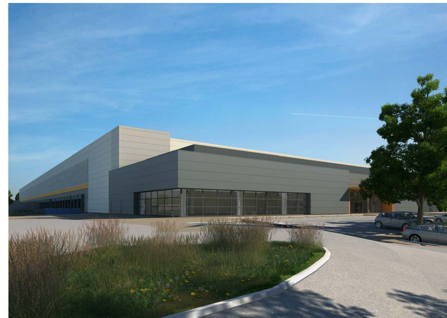
PC6-2 Vue des bureaux depuis l'entrée du parking au Nord