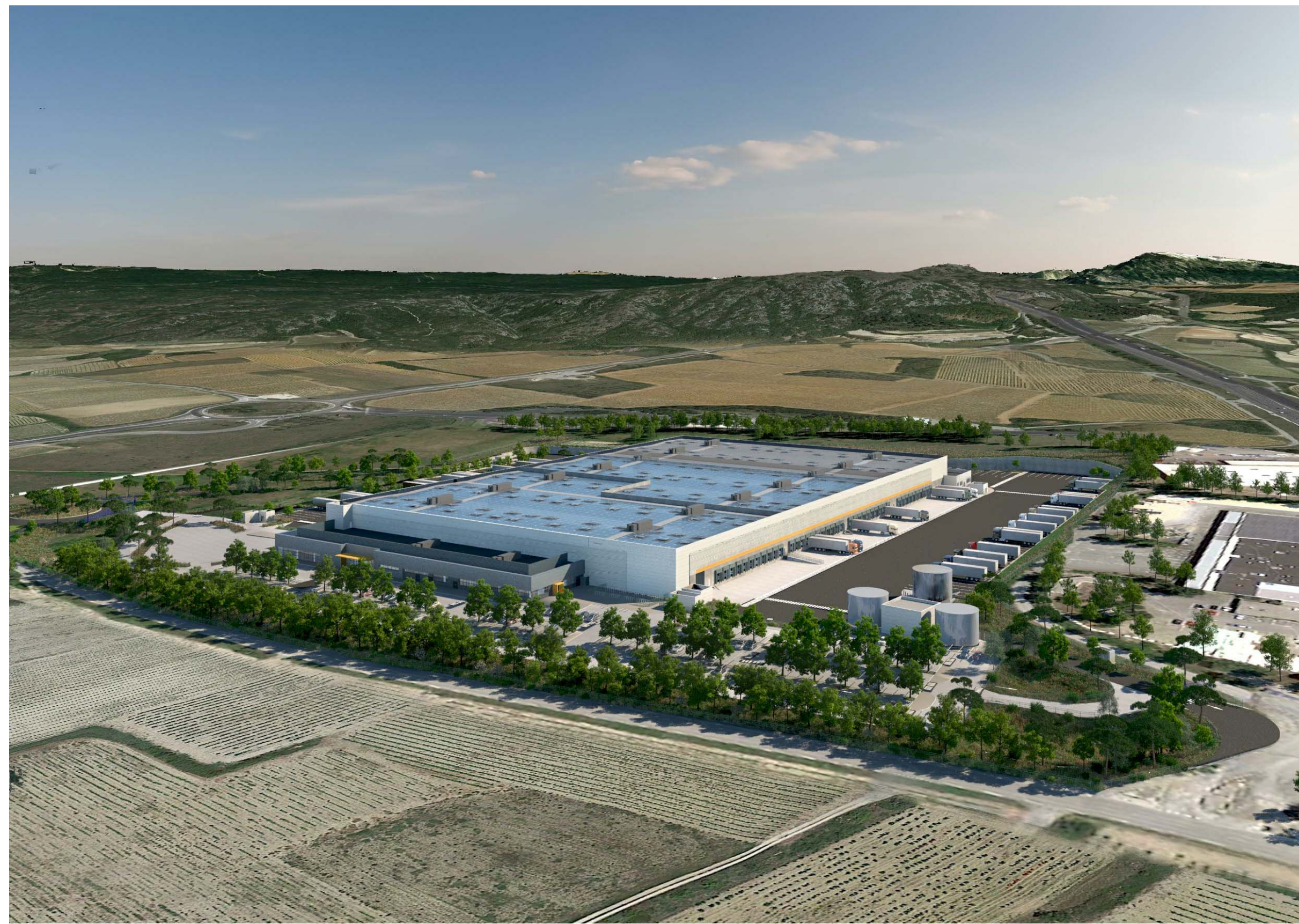
PC6-1 Vue aérienne du Sud-Ouest vers le Nord-Est