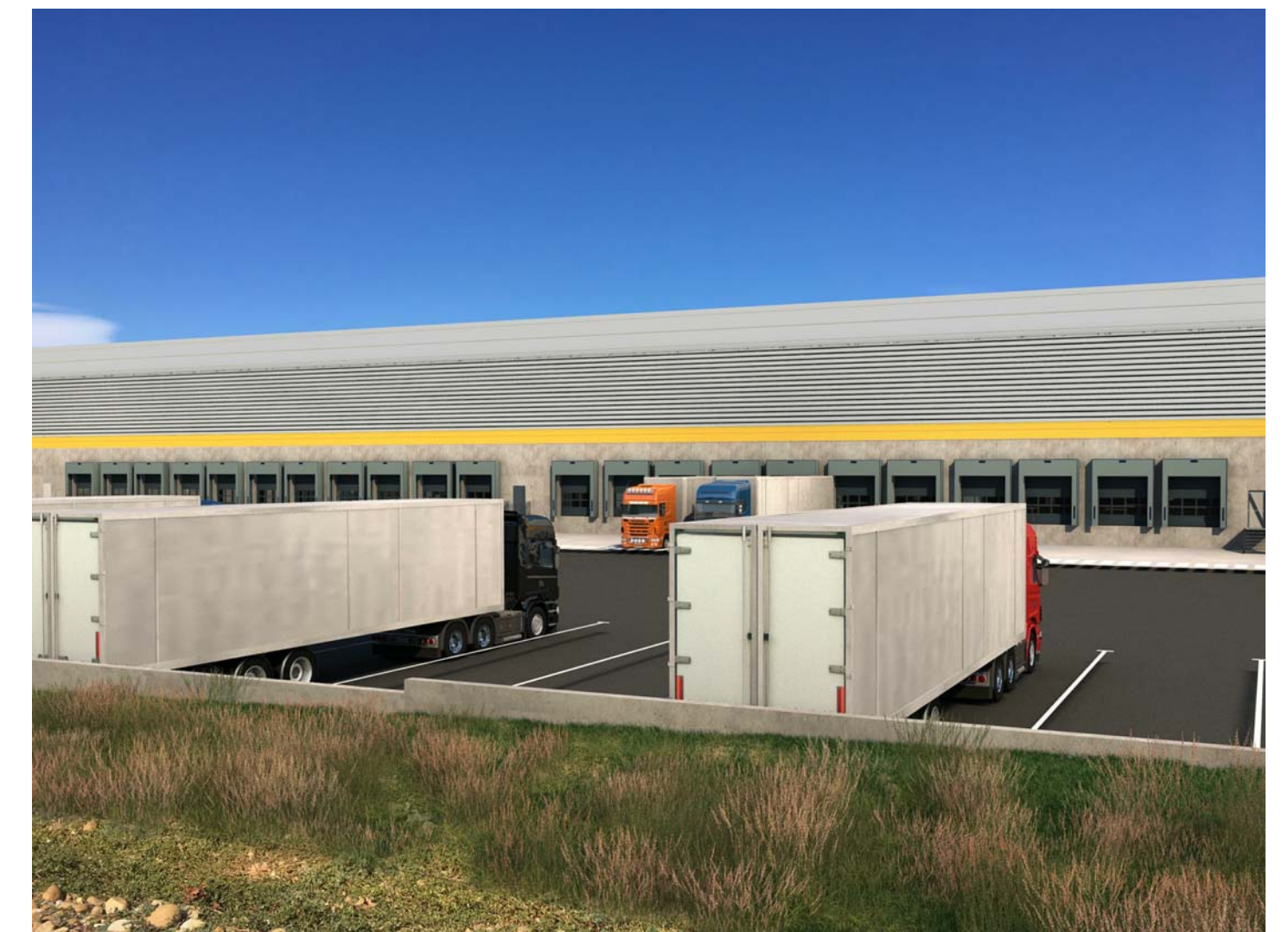
PC6-5 Vue de la zone d'exploitation extérieure Sud, depuis le Sud de la parcelle