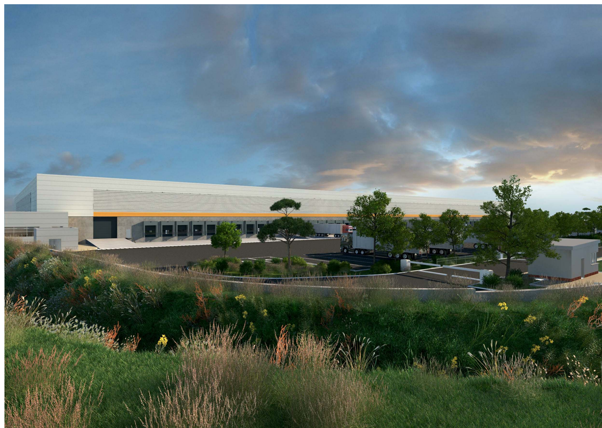
PC6-3 Vue du bâtiment du Nord-Est vers le Sud-Ouest