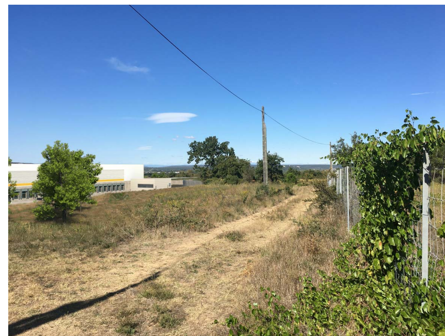
PC6-4 Insertion depuis le Sud-Est du site, vers le Nord-Ouest