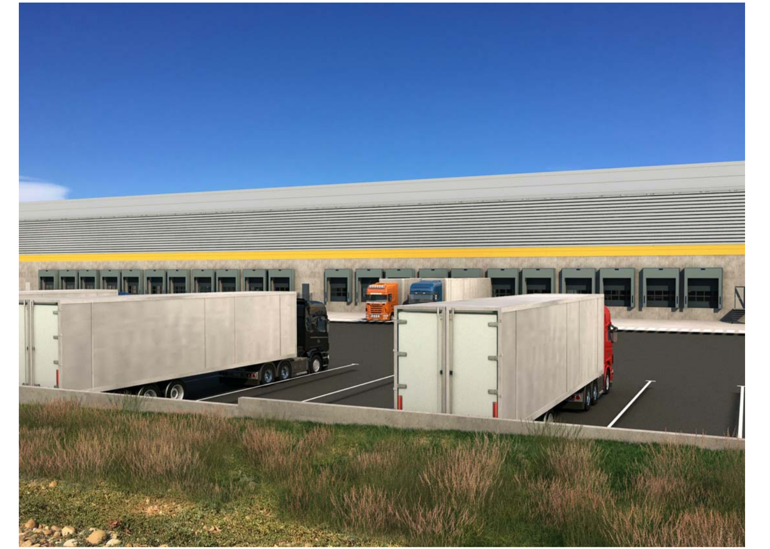
PC6-5 Vue de la zone d'exploitation extérieure Sud, depuis le Sud de la parcelle