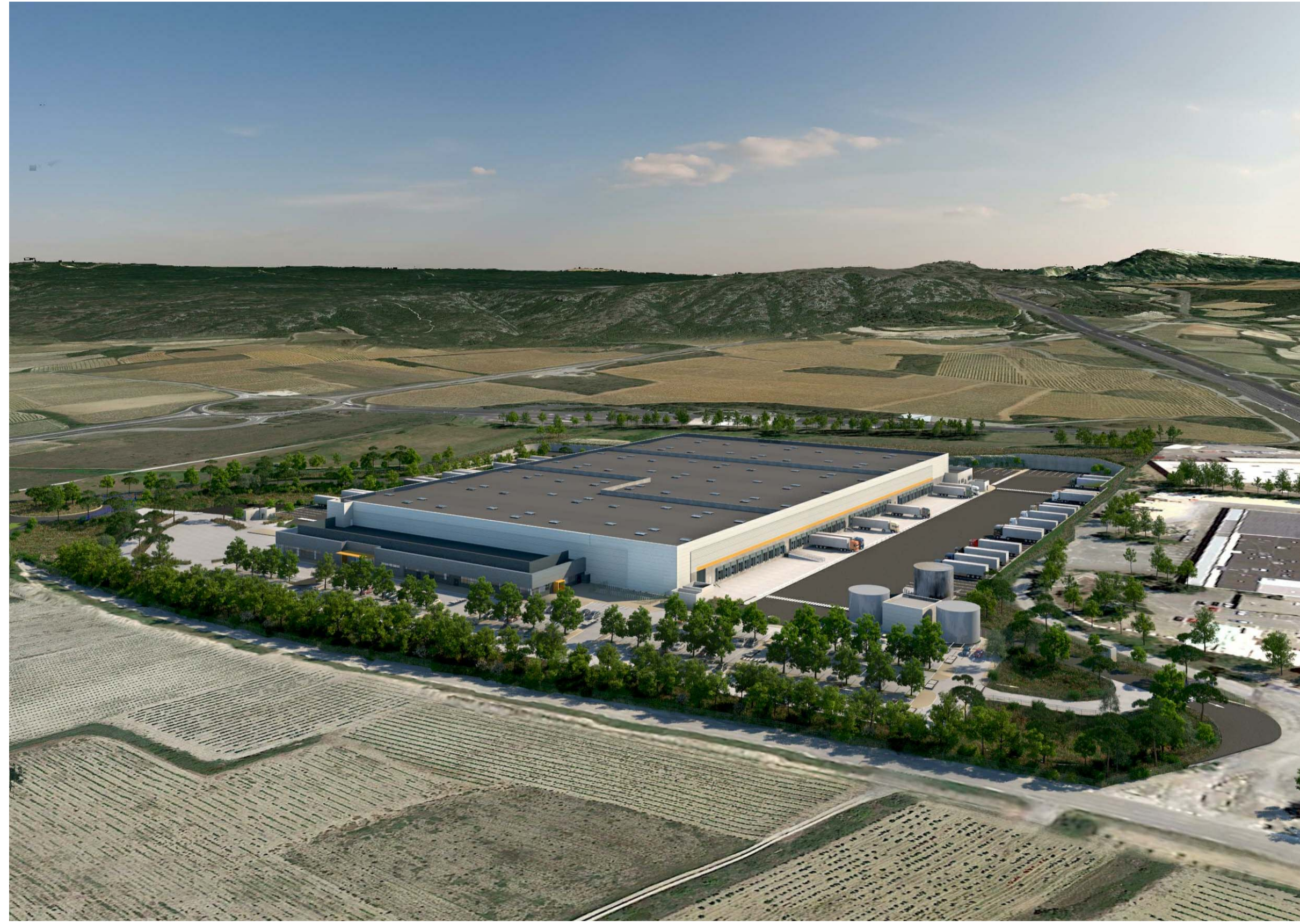
PC6-1 Vue aérienne du Sud-Ouest vers le Nord-Est