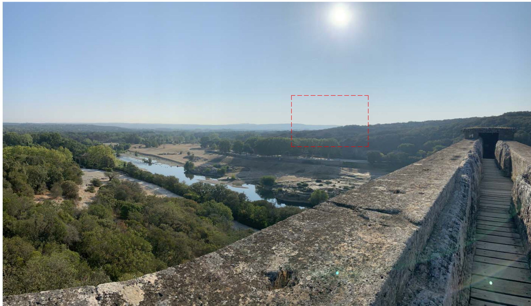
Vue depuis le dernier niveau du Pont du Gard, en direction du futur projet

Localisation du projet, masqué par la topographie et la végétation. L'échangeur autoroutier et le bâtiment existant France Boissons ne sont pas visibles