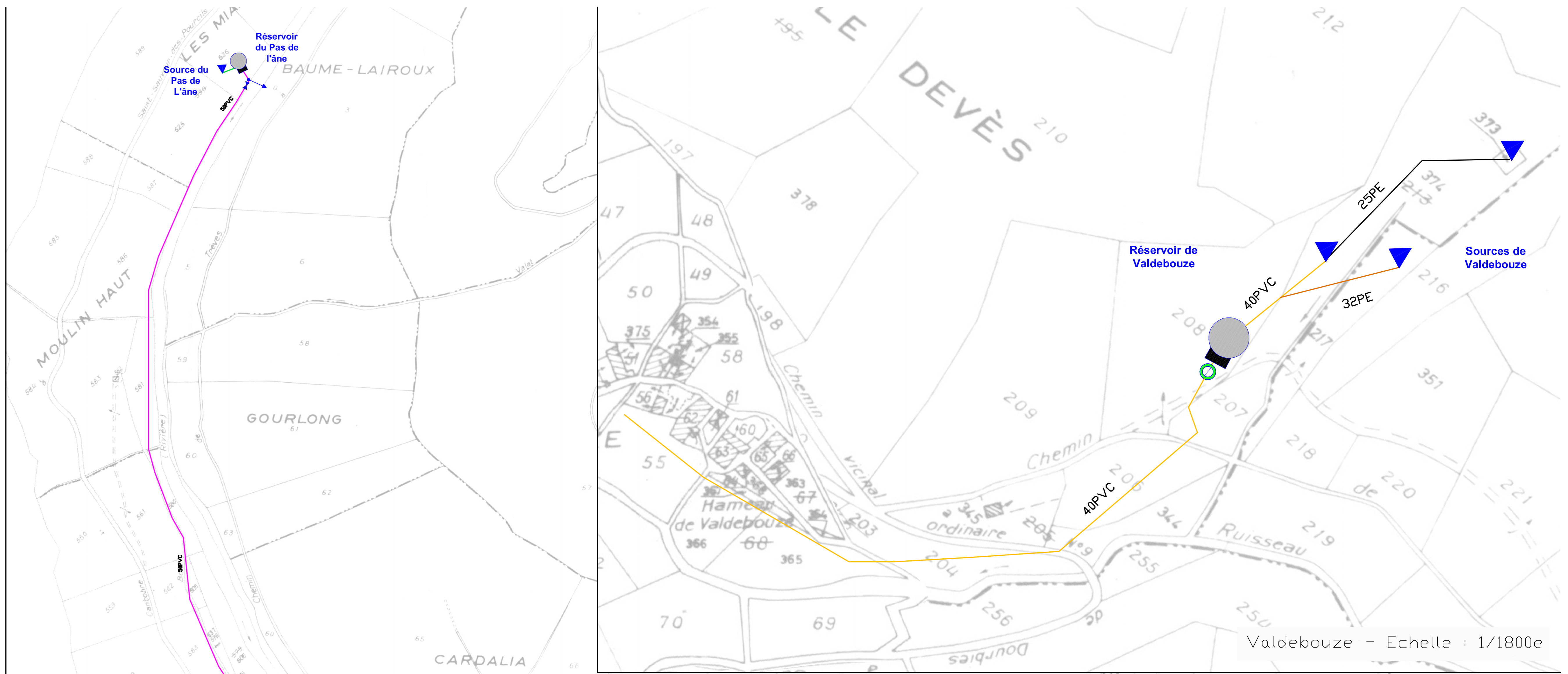
Valdebouze - Echelle : 1/1800e