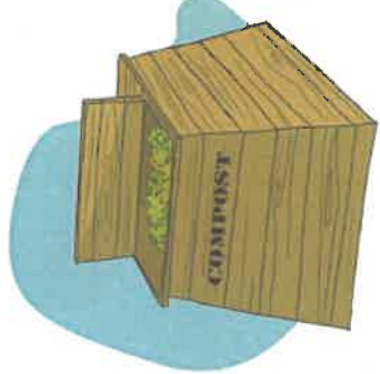
Extrait de l'enquête