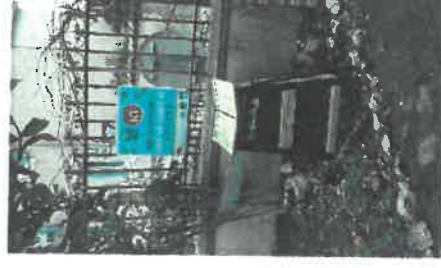
PLPDMA de Métropole NCA