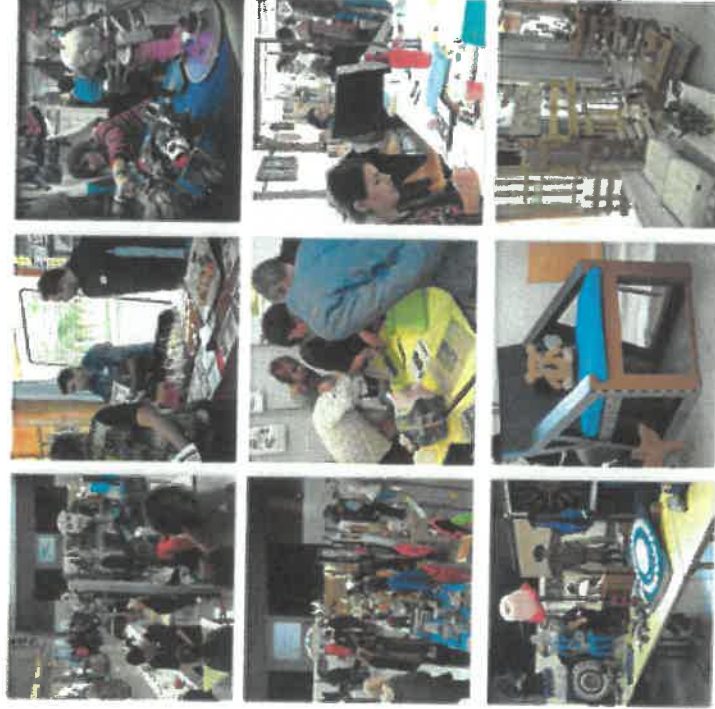
Fête de la récup' : Sud Rhône Environnement