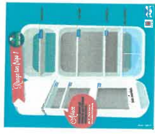
PLPDMA de Métropole NCA