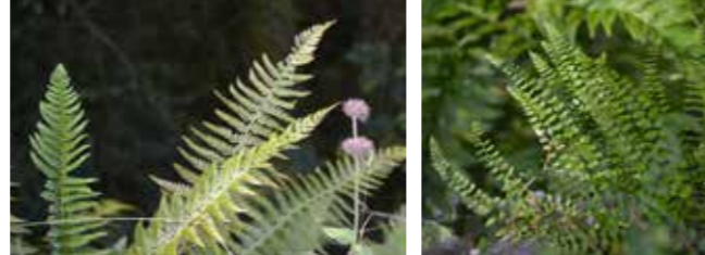
Polystic à aiguillons

La première partie de ce circuit, le long de la falaise, s'est déroulée sur des terrains calcaires du Secondaire. Le socle primaire schisteux était bien sûr présent mais enfoui sous des milliers de mètres de sédiments. Ici, les schistes affleurent, reconnaissables à leur structure feuilletée, avec une inclinaison par endroit proche de la verticale.