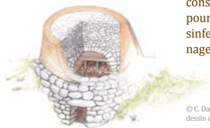
© C. Daquo d'après dessin du four à chaux de Guerville

Produite à partir de la calcination du calcaire à 900°C, la chaux avait des usages multiples : enduits et mortiers pour la construction, amendements pour les sols agricoles, désinfection des étables, tannage des peaux, etc.