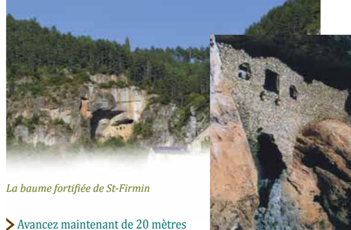
La balme fortifiée de St-Firmin