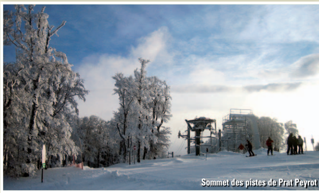
Sommet des pistes de Prat Peyrot