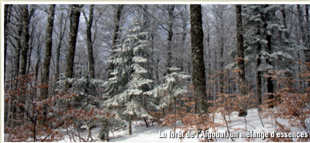
La forêt de l'Aigoual, un mélange d'essences