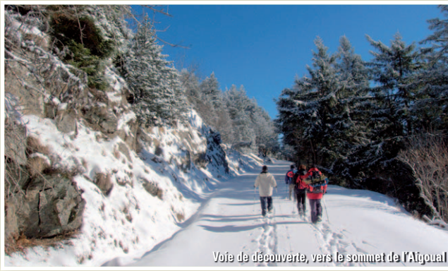
Voie de découverte, vers le sommet de l'Aigoual