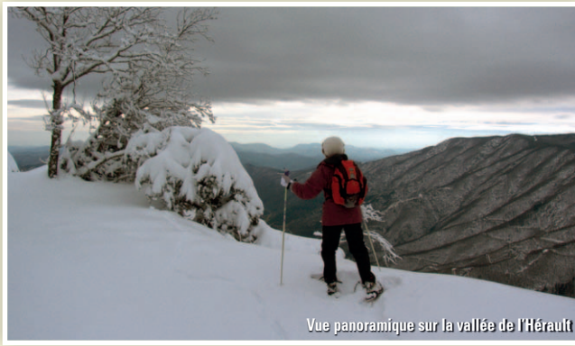
Vue panoramique sur la vallée de l'Hérault