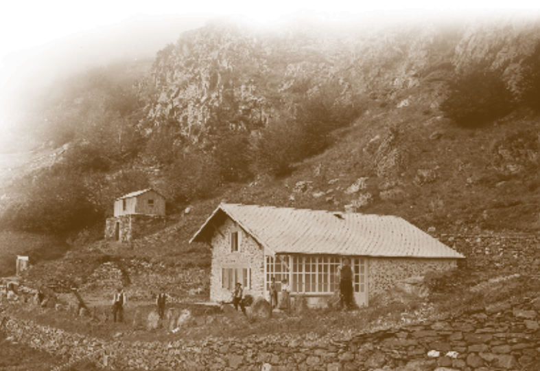
Le chalet laboratoire en 1907